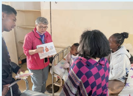
作者向病人和家屬講解傷口護理常識

最後一個憂慮就是當地食水都有污染的情況，我們很容易水土不服或者肚瀉。結果這個憂慮真的出現了，但身體不適卻令我感受到無比的關顧和愛護。醫療隊 24 人，差不多三分之一的人都生病了，不過大家互相關顧，任何隊員不適，其他隊員都將所有的藥物交出給予生病的人，連一些當地沒有的藥物也適時有所供應，雖然病了，但大家很快