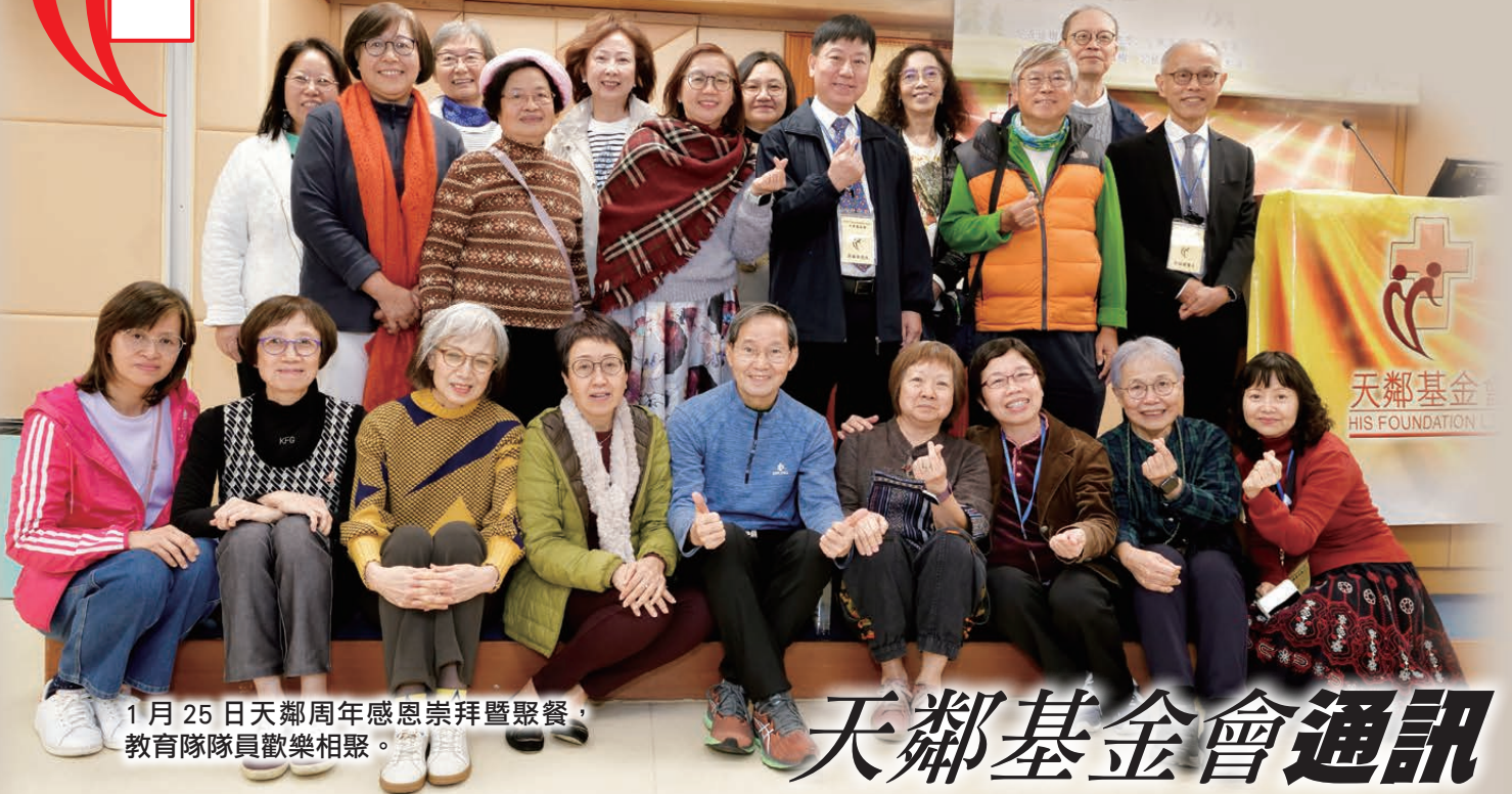
1月25日天鄰周年感恩崇拜暨聚餐，教育隊隊員歡樂相聚。