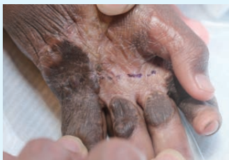
Nekene 2024 年手術前有些指頭與手掌連成一體

Nekene 是一位六歲男孩，也是家中唯一的孩子。父親靠搬運為生，母親則幫人洗衣、打水為生。當他還不到一歲時，父母因工作不得不把他交給鄰居照顧。某天，他在地上爬行時不慎爬進火堆，導致雙手嚴重燒傷。父母依循當地傳統，先用尿液消毒傷口，再買藥膏塗抹。起初似乎見效，但隨著時間過去，孩子的手指逐漸緊縮、變形。父母曾帶他到馬島三間最大的醫院求助，每間醫院都告訴他們，手術費用需約 1,000,000Ar (約港幣 2,000 元)。然而，即使全家每天只吃一餐，也難以存下手術費。孩子因雙手殘缺而變得自卑內向，在學校常被同學嘲笑欺負。父母只能天天在教會禱告，從神的話語中尋求力量。直到有一天，他們看見天鄰隊免費手術的單張，便趕緊去醫院登記。