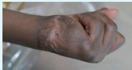
雙手燒傷攣縮 2025 年左手動了手術已明顯改善