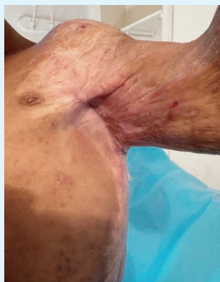
小病人的傷口創面大

手術後多是縫線癒合的傷口未必適用，同事卻鼓勵我把敷料帶去以防萬一。結果又一次見證上帝的信實，行程最後兩天有一位小朋友因燒傷疤痕不能張開腋窩需要作疤痕鬆解，可是手術前發現他有一個傷口在流膿，反而需要先為他清除膿液。在手術前我請媽媽先為他清潔身體，她卻說不懂為兒子洗澡，因燒傷後疤痕黏着他的手很難清洗，而且他們亦沒有經常洗澡的習慣。於是我們為他