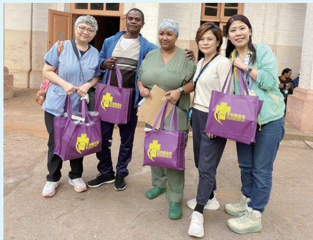
作者（左一）和隊員把護理傷口物資交託當地醫療人員

另外的憂慮是當地的衛生環境欠理想，病人對於手術後傷口護理的知識很貧乏，聽說曾有小朋友打開紗布，讓鄰居看完自己的傷口再將紗布重新蓋上。這樣看來他們對傷口護理的概念真的非常缺欠。但我祈求上帝盡我所能，希望能預見他們的困難有所準備。出發前，同事遞給我一包填充傷口的敷料，說或者用得着，我告訴他