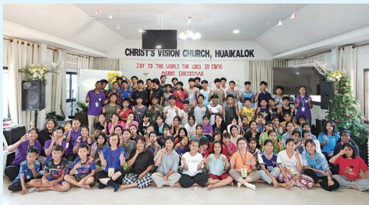
隊員與 MMEC 學生活動後合照，興奮莫名。