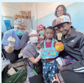
作者（左一）與隊員鼓勵病人和家屬