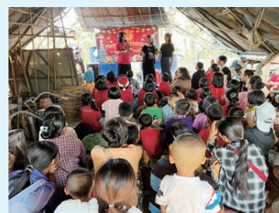
隊員表演魔術深受歡迎