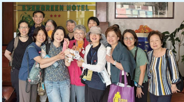
作者（前排左三）和隊員們互相關顧，相處融洽。