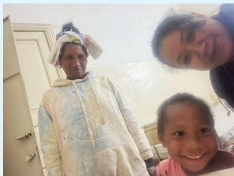
小病人康復後滿臉笑容跟當地醫生合照