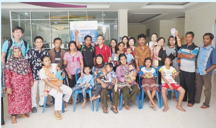
2014 年印尼楠榜唇腭裂隊，作者（後排左一）和隊員與病人及家屬合照。