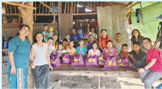
教育隊隊員到村落探訪 MMEC 學生家庭

請電郵 info@hisfoundation.org.hk /WhatsApp 6575 1991 / 致電 2794 9400 天鄰辦公室。