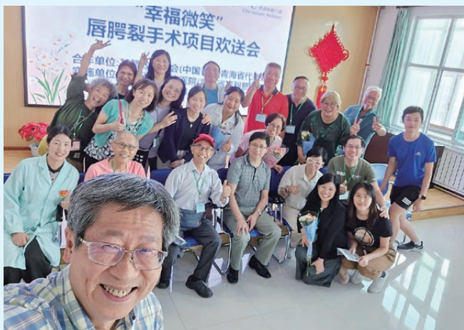
2024 年作者（左一）與隊員在青海完成唇腭裂手術服務，感恩雀躍。

事實上我也是第一批天鄰義工，參與這機構超過三十年了，還比我過往在公營機構全職工作時間更長，沒有轉職或離職，亦是因為天鄰的手術服侍工作，正如聖經說主耶穌的榜樣，走遍各城各鄉