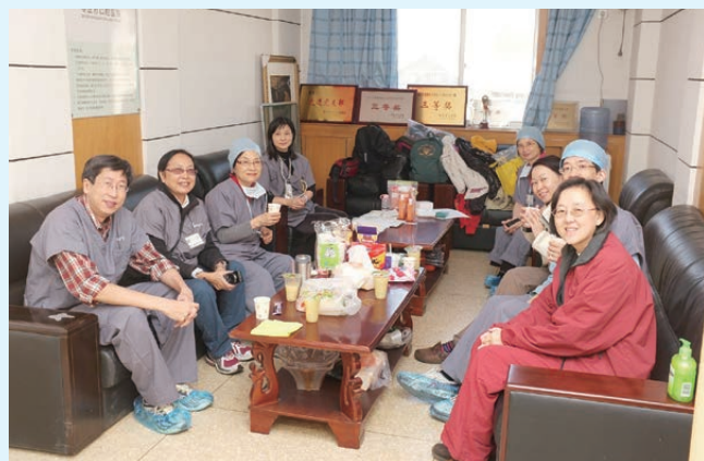
2011 年山東棗莊唇腭裂隊，作者（左一）與隊員於醫院休息室。