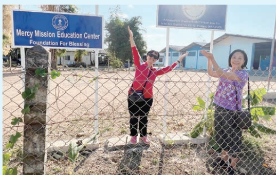
MMEC 位於小山丘上，鄰近緬甸邊界。