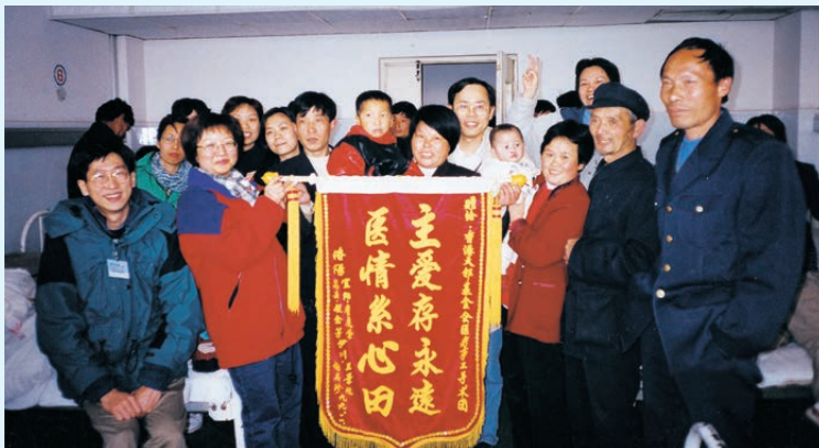
1998 年作者（左一）與醫療隊員獲河南洛陽病人和家屬致送錦旗表達謝意

工作，在基督耶穌裡造成的，為要叫我們行善，就是 神所預備叫我們行的。」《弗 2：10》回應歌詞「縱然有許多的問題，我也不放棄，祢大能賜給我勇氣，我會勇敢走出去」！心之所願。