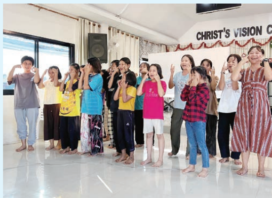
MMEC 學生都喜歡唱歌和玩遊戲