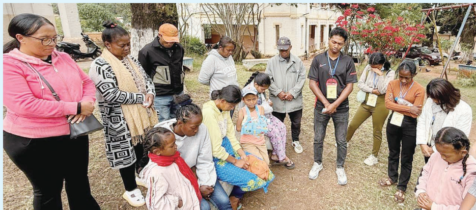
病人、家長和翻譯員齊心為接受手術的病人祈禱