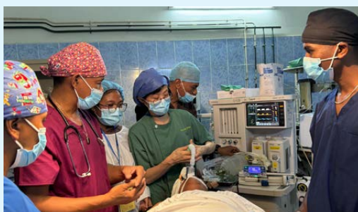
麻醉科梁醫生協助乳癌切除手術