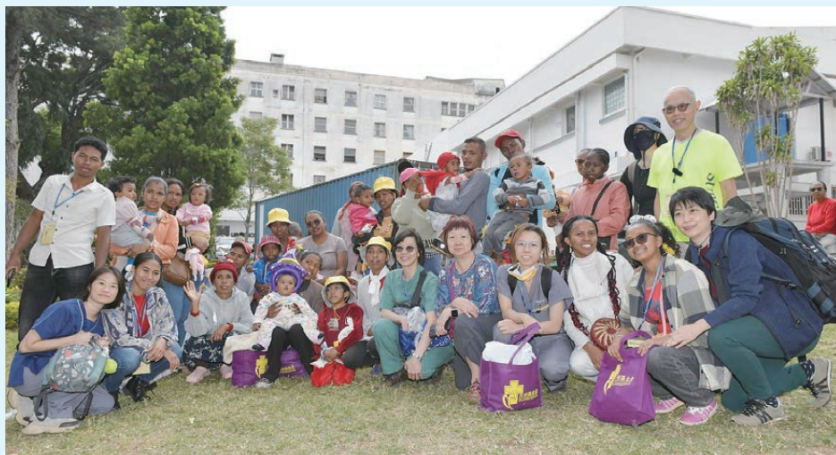
隊員與馬島病人道別