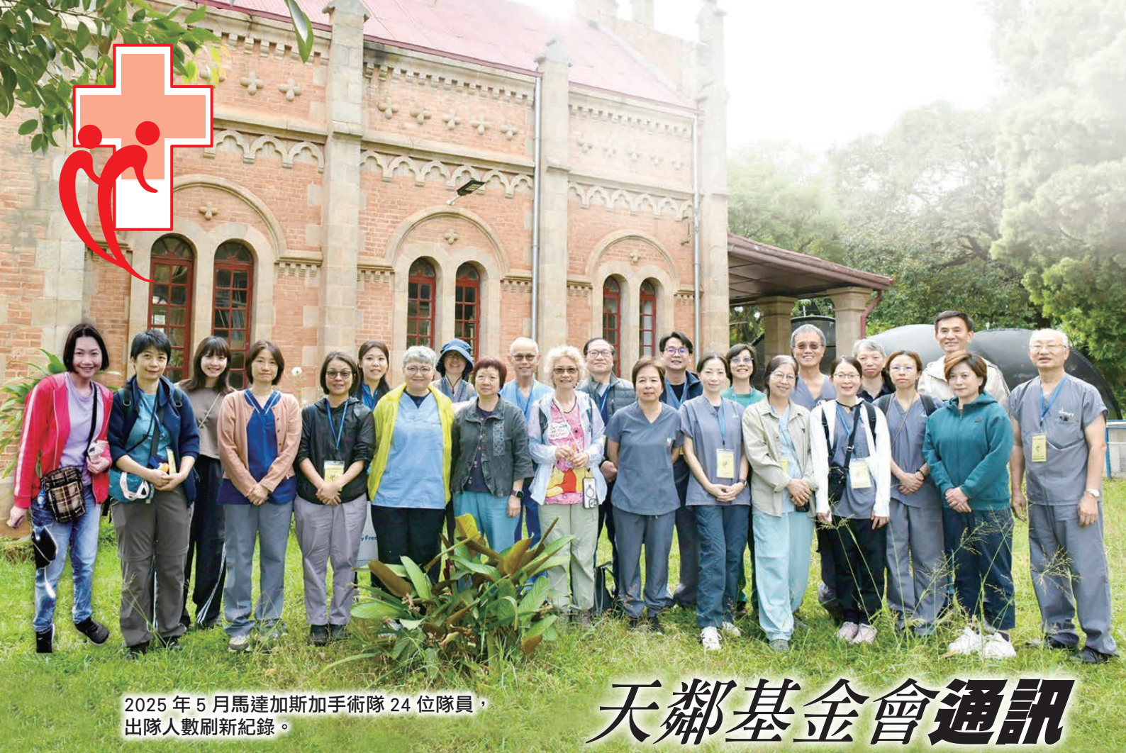
2025 年 5 月馬達加斯加手術隊 24 位隊員， 出隊人數刷新紀錄。