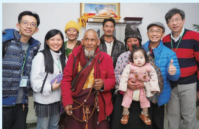
2017 年作者（右一）與唇腭裂隊隊員在青海開展少數民族的醫療服侍

當每次講述自己信主的見證，我都會提到在 1988 年從英國完成基礎的口腔頤面外科訓練回港前，求神給我三個願景：第一，在這專業可以醫治貧病及有需要的病人；第二，將來可以在國內提升醫療專業的水平；第三，返港後可以在教會服侍。回望這三十多年的人生閱歷，我感恩神如何用我這愚昧的小子，使我可以跟