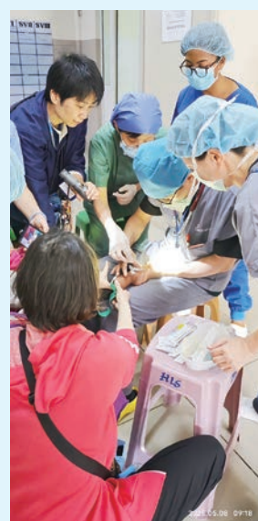
為兩歲小朋友全身麻醉前預備靜脈輸液