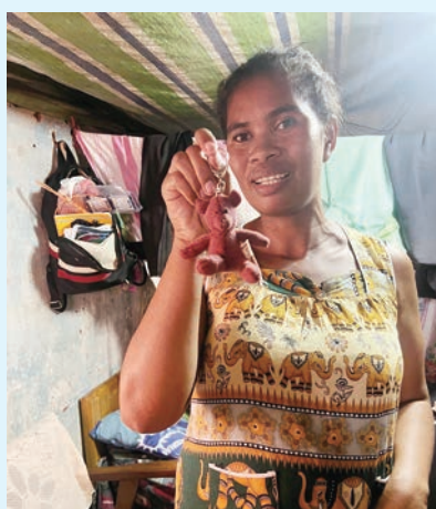
婦女參加了京城堂小熊手工計劃，從前每天只吃一餐，現在可以一日三餐，及搬往略為大一些的居所。