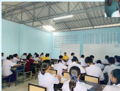
澳洲天鄰捐贈100套學生桌椅、10套教師桌椅和10塊白板連手推架，改善學習環境。

請電郵 info@hisfoundation.org.hk /WhatsApp 6575 1991 / 致電 2794 9400 天鄰辦公室。