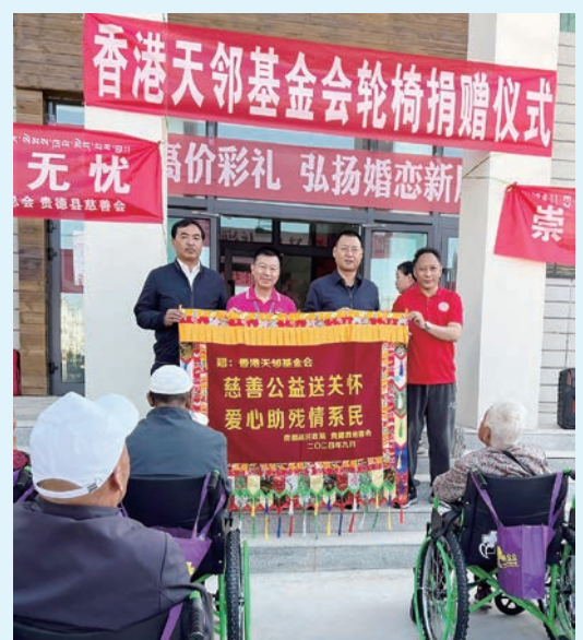
2024 年 9 月作者（左二）帶領隊員首次到青海省捐贈輪椅

2014 年 7 月 30 日香港天鄰輪椅事工小組正式成立，並在 2015 年開始出隊。2020-2022 年新冠肺炎疫情爆發，輪椅隊暫停出隊；我們祈禱等候上主重開輪椅捐贈之門。神果然垂聽禱告，2023 年 6 月和 9 月輪椅隊隊員再次踏上服侍旅程，至 2024 年更排除萬難，首次進入青海省捐贈輪椅。天涯若比鄰，愛心傳千里！