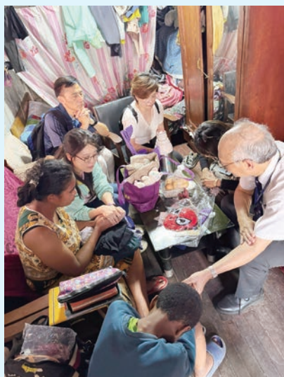
隊員齊心為病人祈禱