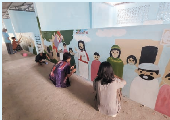
隊員帶領學生繪畫壁畫「撒該快下來」