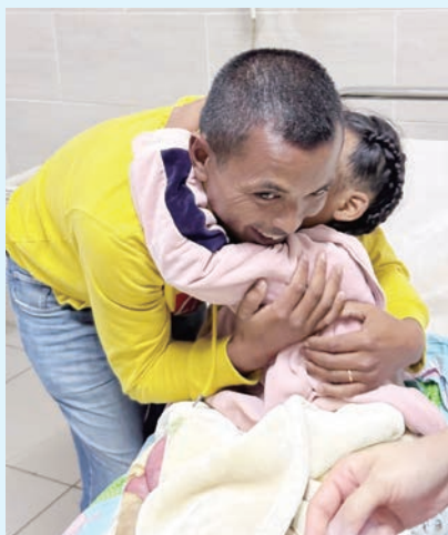
爸爸很高興在復蘇室見到女兒順利完成手術