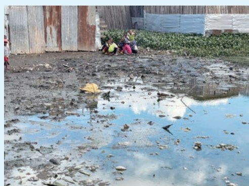
居屋旁邊是看似天空之鏡的臭水坑，小孩們就在此玩耍。