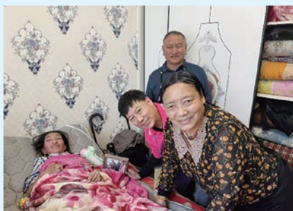
受助者感受隊員們的愛和關心，喜極而泣。

助者家中，與受助者有密切接觸，彼此心靈互相觸動。我看見受助者接收輪椅時喜極而泣，這對我們有著很大的鼓舞。其中有一位終生癱瘓，臥床四十多年的女士，給我留下最深刻的印象。她的眼神充滿絕望，生命中就像沒有靈魂，每天只從窗子向外望，看見一點點陽光。