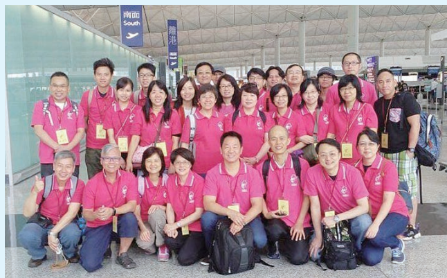
2015年5月17至23日第一次輪椅隊，28名隊員人數最多。