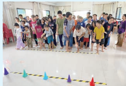
分組遊戲考眼力和手力