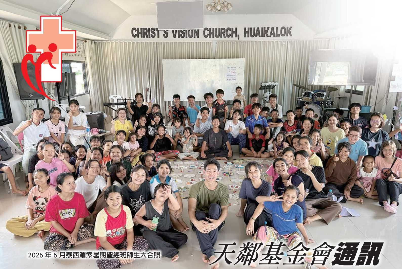
2025 年 5 月泰西湄索暑期聖經班師生大合照