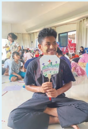
同學自己設計紙扇，愛不釋手。