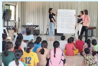
隊員教學生唱詩歌學英文