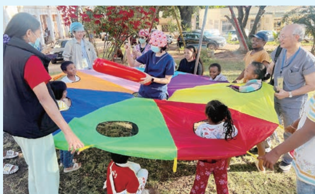
遊戲治療為病人帶來歡樂，也減少痛楚和恐懼。